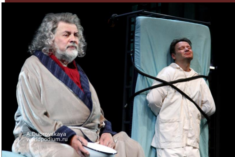
3. Спектакль «Где мы?..». | 4. П.И. Чайковский «Пиковая дама»